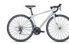
Dolce(ドルチェ) サイズ:S (目身長155cm~165cm)

※自転車に乗る際は必ずヘルメットを着用してください。(レンタル可) ※レンタルした自転車は必ずホテルにご返却ください(乗り捨て禁止)。 ※一度にレンタルできる自転車は4台までです。