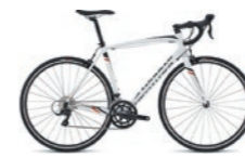
Allez(アレー) サイズ:M (目身長165cm~175cm)

アメリカの自転車メーカー。男女問わず、初心者から上級者、街乗りからレーサーまで豊富なバリエーションに対応。幅広い人気がある名実ともにトップクラスの自転車メーカー。AllezとDolceは初心者にも乗りやすい設計に作られたロードバイク。